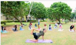
SOUL STAR RETREATS